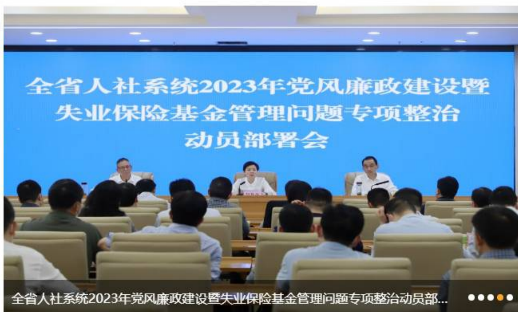
全省人社系统2023年党风廉政建设暨失业保险基金管理问题专项整治动员部...