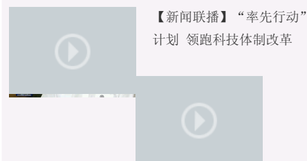
【新闻联播】“率先行动”计划 领跑科技体制改革