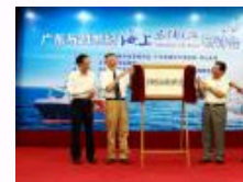
“广东与21世纪海上丝绸之路”研讨会在中山大学