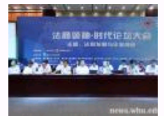
“法商领袖&#8226;时代论坛”第一届论坛大会召