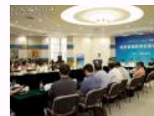
信用管理教育发展研讨会在人大举行 发布《信用