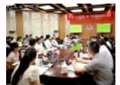
第十五届四校马克思主义学院博士生论坛举办 聚