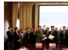
对外经贸与中国民营经济国际 合作商会签署共建协