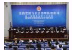
中南财经政法大学打造社会 治理法治一流智库