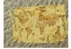
发挥历史学的社会功能—— 高校历史学家对落实十