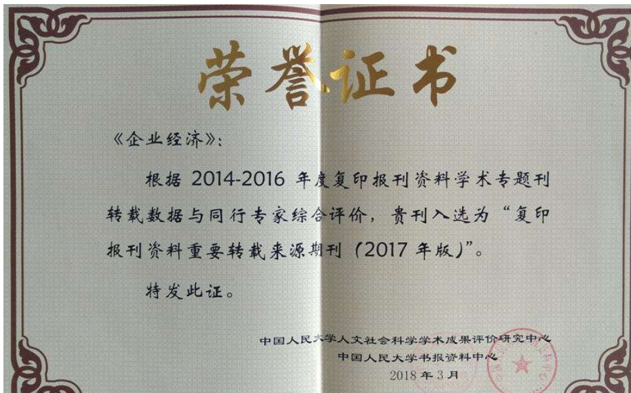
《企业经济》杂志入选“人大复印报刊资料重要转载来源期刊”荣誉证书

2018年3月27日, 中国人民大学人文社会科学学术成果评价研究中心和中国人民大学书报资料中心联合发布《复印报刊资料重要转载来源期刊(2017年版)》, 《江西社会科学》《企业经济》继续入选复印报刊资料重要转载来源期刊。