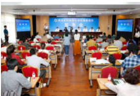
我校西北乡村调查报告在“农民丰...