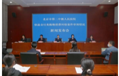
3月15日10时，北京二中院召开快递交付类购物消费纠纷案件情况新闻发布会