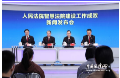
最高法举行人民法院智慧法院建设工作成效新闻发布会