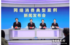
网络消费典型案例新闻发布会