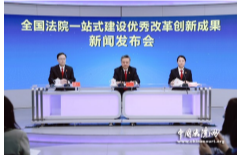
全国法院一站式建设优秀改革创新成果新闻发布会