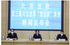
1月11日14:30，北京高院召开北京法院第三届司法改革“微创新”案例新闻发布会