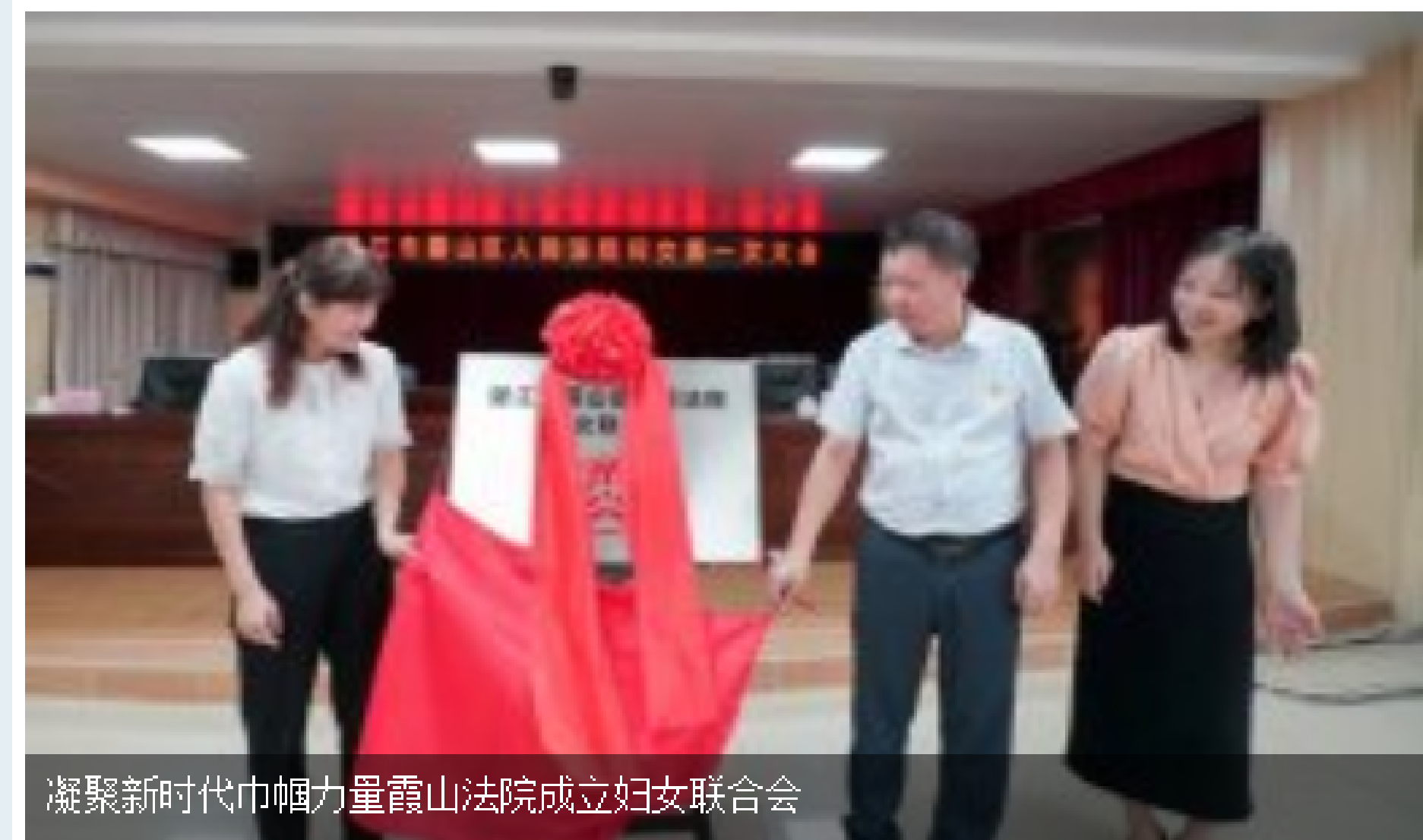
凝聚新时代巾帼力量 霞山法院成立妇女联合会