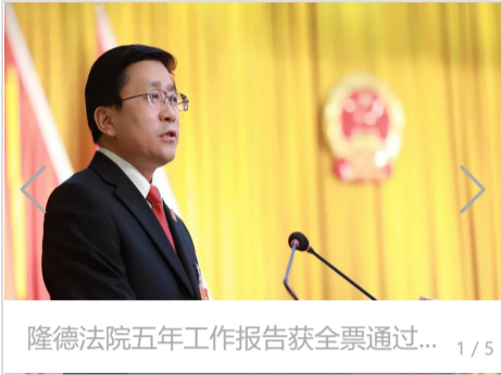
隆德法院五年工作报告获全票通过... 1/5