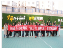
弘扬“五四”精神 展现...