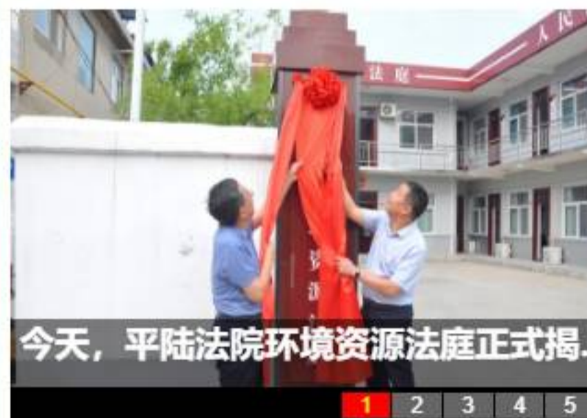
今天，平陆法院环境资源法庭正式揭...