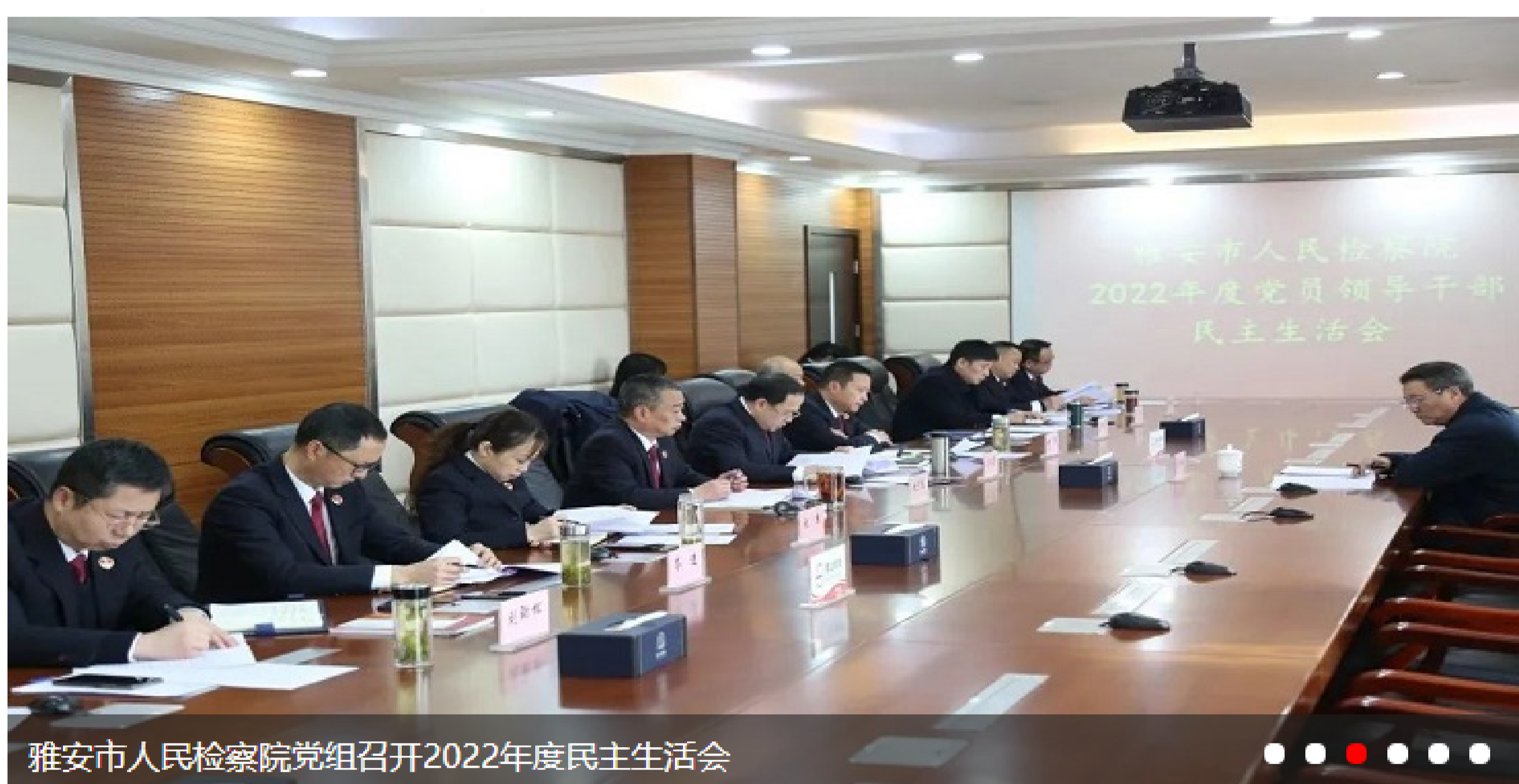
雅安市人民检察院党组召开2022年度民主生活会