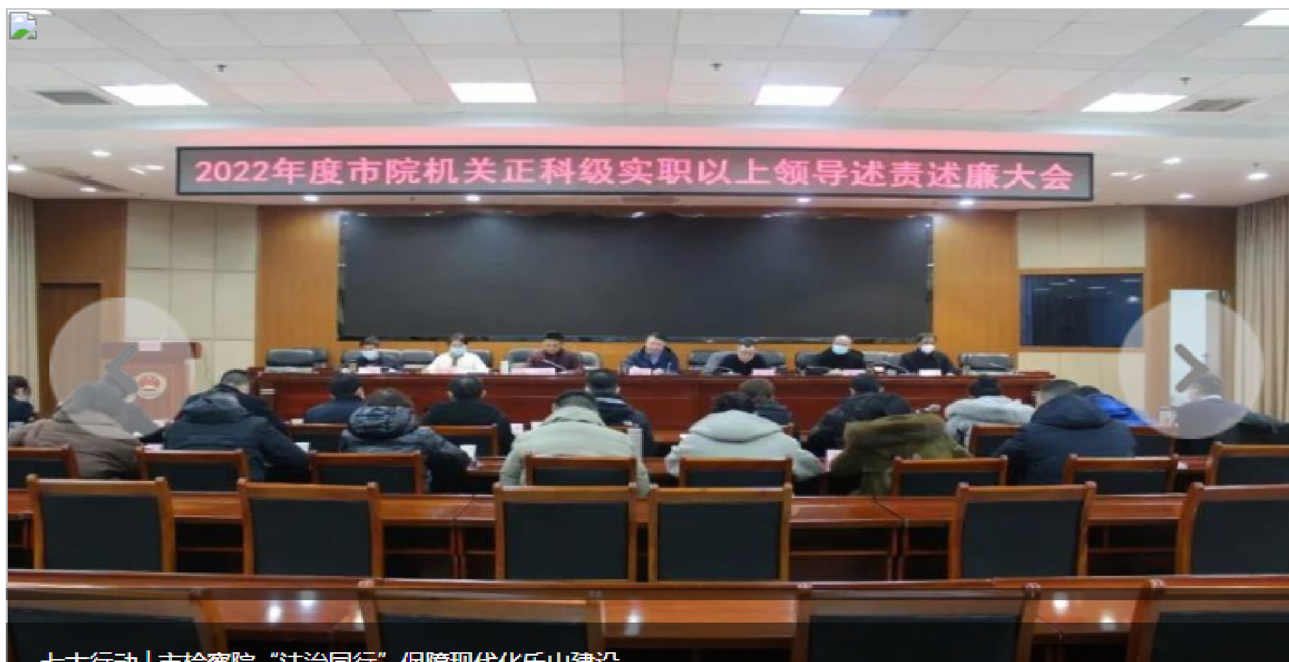
七大行动|市检察院“法治同行”保障现代化乐山建设