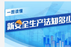
一图读懂! 新安全 ...