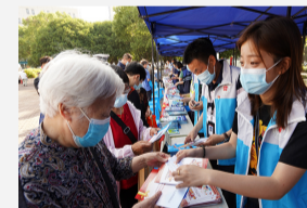
每日一图 | 法 ...