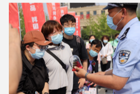
全民禁毒 筑牢防 ...