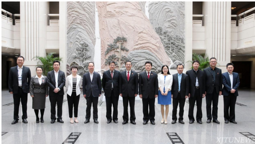
最高人民法院党组书记、院长周强，最高人民法院党组成员、政治部主任徐家新 同参加座谈会的专家学者合影。左三为西安交大法学院院长单文华教授

5月5日上午，最高人民法院交流挂职学者座谈会在京召开。最高人民法院党组书记、院长周强出席座谈会并讲话。最高人民法院党组成员、政治部主任徐家新主持座谈会并宣读了全国人大常委会和最高人民法院党组的有关任免决定。西安交大校长助理、法学院院长单文华教授入选第二批挂职学者，担任最高人民法院司法案例研究院副院长，并作为第三批交流挂职学者代表发言。西安交大副校长席光受邀参加座谈会，社科处贾毅华处长一同参会。