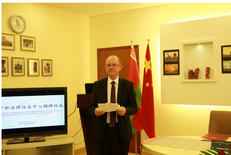
白俄罗斯驻沪总领事瓦列里·马采利致辞