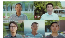
成为更好的大学, 遇见更好的你