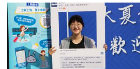
2018ECNUers 今日相遇 未来可期