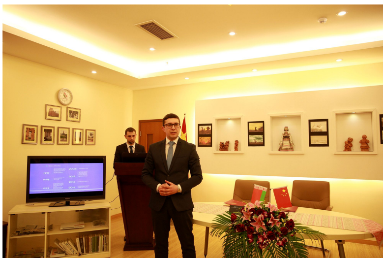
白俄罗斯国家法律信息中心主任叶甫盖尼·科瓦连科致辞

科瓦连科在致辞中高度评价我校在对白交流合作中做出的努力和取得的成果,他指出,白俄罗斯共和国国家法律信息中心一直以来致力于白俄罗斯法律信息空间的对外发展合作,日前俄罗斯、哈萨克斯坦、波兰等国已开设了白俄罗斯法律信息中心。这次在我校设立的法律信息平台将为中白两国在法律信息领域的相互理解、交流与合作做出贡献。随后,白俄罗斯国家法律信息中心法律信息宣传局宣传与用户处顾问瓦连京·别尼亚兹向与会者介绍了白俄罗斯法律信息中心网站的使用方法、资料获取途径等相关信息。