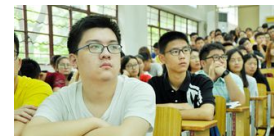
这是新生的第一堂思政课!