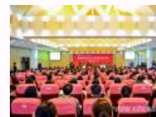
山东大学承办第八届中国法学家论坛