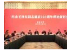
北京大学举行纪念毛泽东同志诞辰120周年理论研