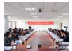
山东大学举行山东区域经济发展研讨会