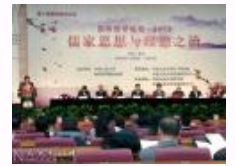
“国际儒学论坛2013”召开探讨儒家思想与理想