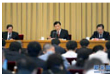
1. 项目评审工作会议