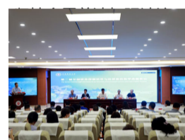
第二届全国涉外律师培...