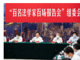
王晨在“百名法学家百...