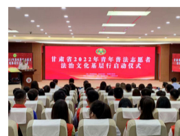
甘肃省2022年青年普法...