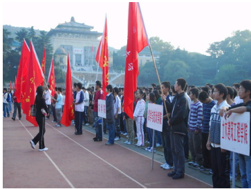
让运动成为习惯，让生...