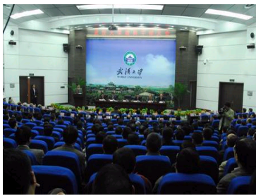
李健任武汉大学党委书...

与会者表示，该论坛的举办促进了青年学者间的交流，拓宽学术视野，启迪科学思维，将对他们的研究和成长起重要促进作用，希望此类学术交流活动能持续开展下去。