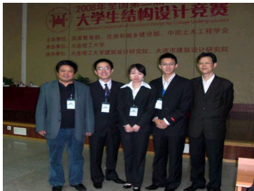
武大学子在全国大学生...