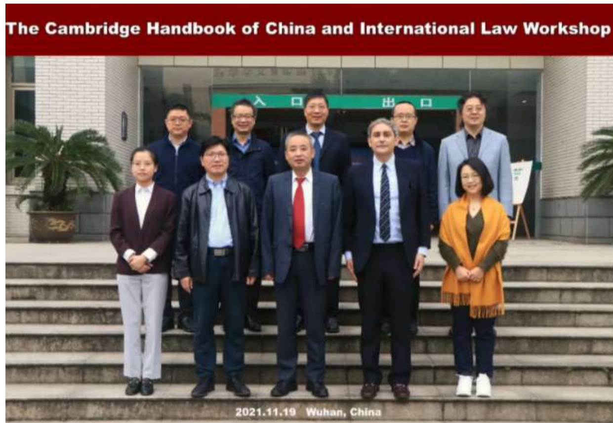
Welcome and Introduction

2021年11月19日, 由武汉大学国际法治研究院、武汉大学国际法研究所主办的The Cambridge Handbook of China and International Law Workshop在法学院120报告厅顺利召开。会议采取线下加线上相结合的形式, 来自10个国家和地区的17位知名国际法学者参会, 对“中国与国际法”的系列问题进行系统而深入的阐释。