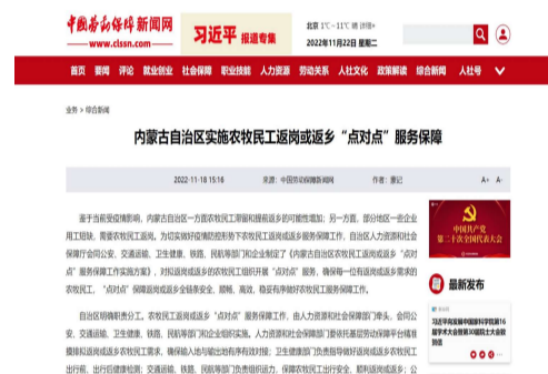
[中国劳动保障新闻网] 新闻 | 内蒙古自治区实施农牧民工返岗或返乡“点对点”服务保障 2022-11-22