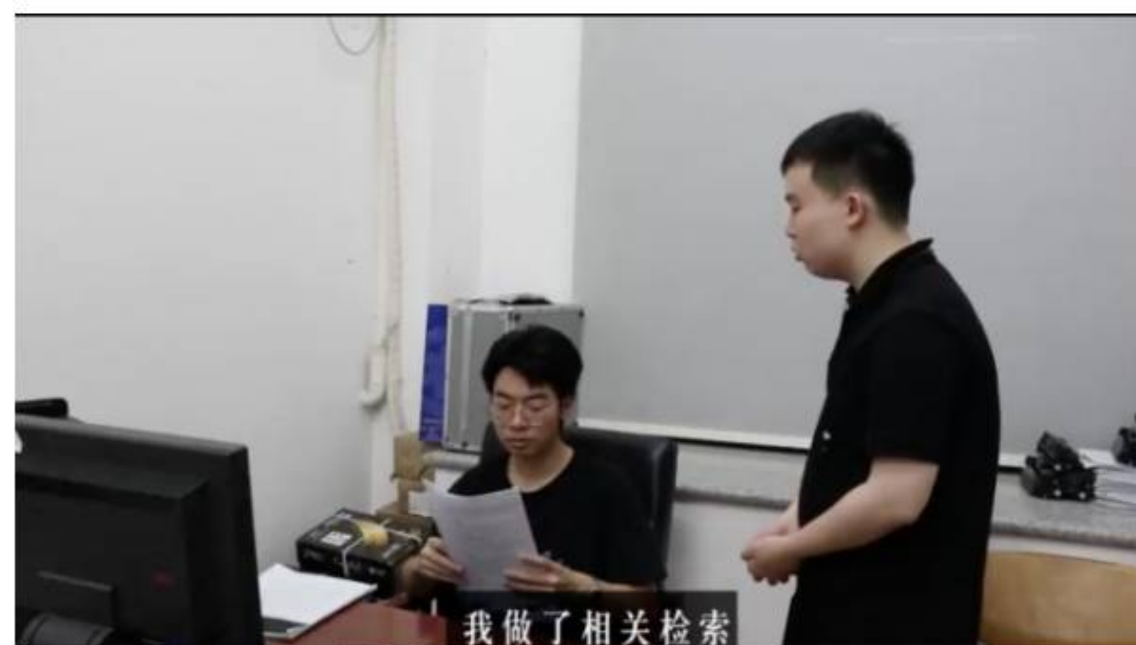
《关于我失去专利新颖性这件事》视频参赛作品截图

一直以来, 公管学院高度重视、积极深化落实普法工作。每年“12·4”国家宪法宣传周、“4·26”全国知识产权宣传周, 公管学院都举办系列宣传教育活动, 积极传播法律知识、弘扬法治精神, 增强广大师生的法治观念。近年来, 普法活动得到了学校文化品牌建设项目“谷雨计划”的持续资助和支持。正是在学校、学院的长期指导和支持下, 经过多年来普法活动的积累和锻炼, 复建成立一年多的知识产权学社才能首次参赛就取得好成绩。