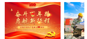
【专题】奋斗百年... 新疆喀什