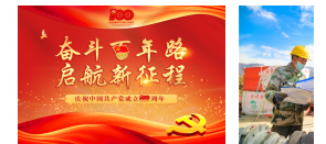
【专题】奋斗百年... 新疆喀什