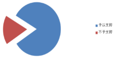
医疗损害案件中精神损害抚慰金 判决认定分布图