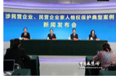
涉民营企业、民营企业家人格权保护典型案例新闻发布会