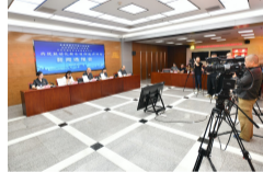
9月27日9时，三中院、朝阳法院、朝阳区卫健委联合召开府院联动化解和预防医疗纠纷白皮书新闻通报会