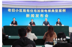
老旧小区既有住宅加装电梯典型案例新闻发布会