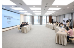
11月1日10:30，北京互联网法院召开个人信息保护案件审理情况新闻通报会