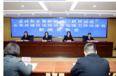
11月10日10时，西城法院召开坚持和发展新时代“枫桥经验”诉源治理工作白皮书新闻通报会