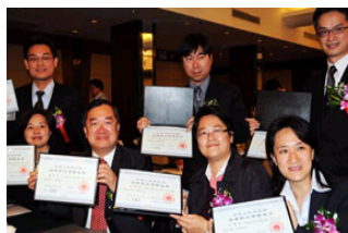
37名台湾居民首次获得大..