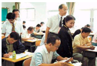
24万名考生参加2005年国..