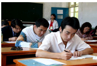
国家司法考试今日开考