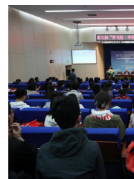
第六届“罗马法·中国法 研讨会成功召开