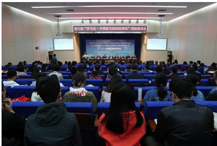
(第六届“罗马法·中国法与民法法典化”国际研讨会)

本届国际研讨会由我校罗马法与意大利法研究中心、中国和意大利法典化和法学人才培养研究中心、法律硕士学院，意大利罗马第二大学、意大利罗马第二大学拉丁美洲研究中心主办，我校法律硕士学院承办。大会主题为“二十一世纪民法典的科学体系”，下设民法典与法源、民法典与刑法、民法典与婚姻继承、民法典的编纂、民法典与债权、民法典与物权、民法典与侵权责任、民法典与继承八项具体议题。国内外170余位学者、法官、检察官和律师等法律界人士出席本次国际研讨会，共襄盛举。