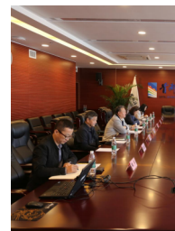
我校与首都体育学院