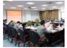
第四届自由贸易法治论坛暨中国国际经济贸易法学