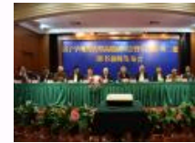
大型古籍文献整理工程《子藏》第二批成果发布