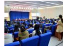
北京市经济法学会2014年年会在中国政法大学召开