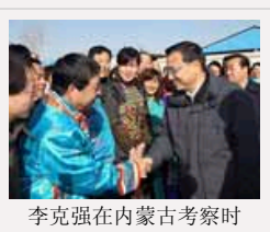
李克强在内蒙古考察时