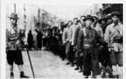
揭秘: 陈独秀辞去总书记职务真相