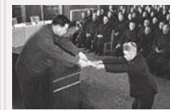
【相册】分7批 特赦黄维 杜聿明等战犯