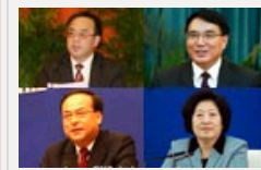
从省级主要领导调整看用人导向