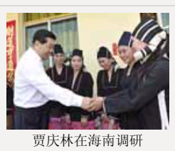
贾庆林在海南调研