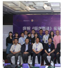
“庆祝《反垄断法》实... 会在北京顺利召开