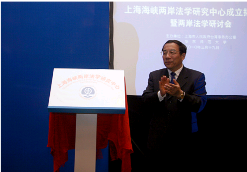
上海市委常委杨晓渡为中心揭牌