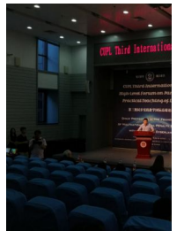
第三期同步实践教学国际高端论坛