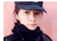
新疆美女民警走红