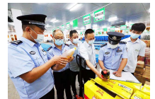
构建校园食品安全 ...