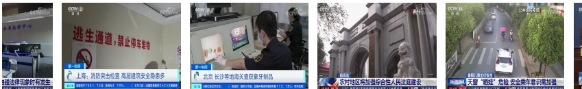
台兴起 象 ... 上海: 消防突击检查 高层建筑安 ... 北京 长沙等地海关 查获象牙制品 ... 最高法 农村地区将 加强综合性人 ... 暑期儿童出行安全 广 天窗“晒娃” ... 破