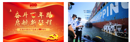
【专题】奋斗百年... 巡航