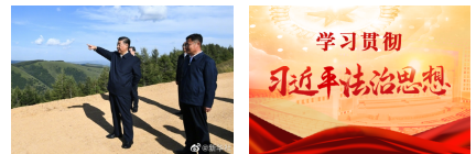
习近平在塞罕坝机... 【专题】学习贯彻...