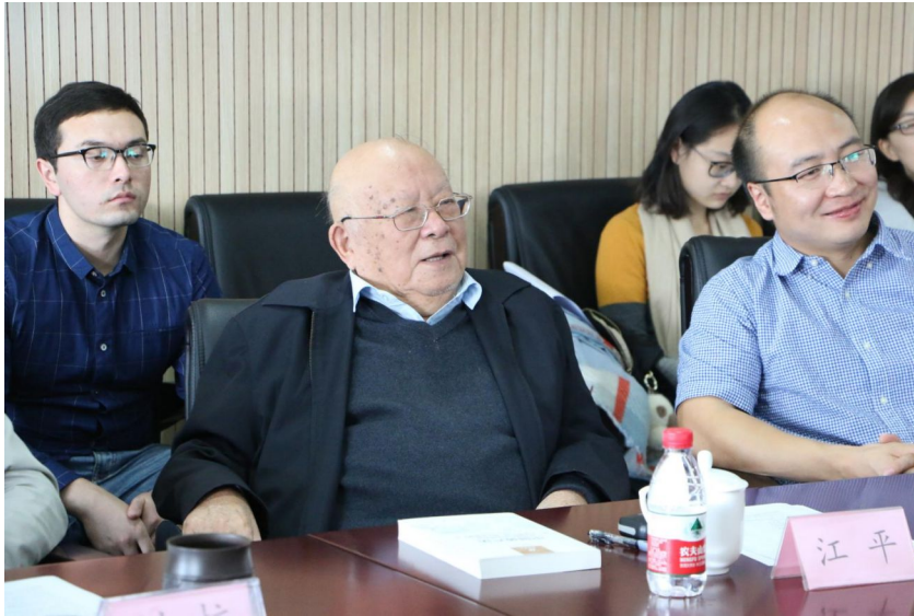
(江平教授在会议上发言)

【新华社】习近平 沈德咏校友向母校 我校举行庆祝201 教育部党组任命胡 中国政法大学201