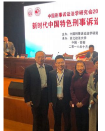
刑事诉讼研究所教师参与中国刑事诉讼法学研究会2018年学术年会