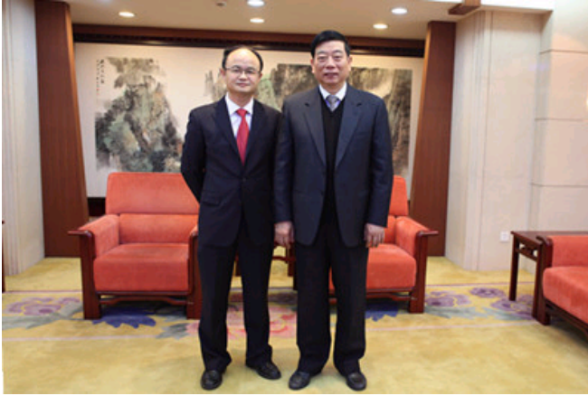
中国法学会副会长兼秘书长鲍绍坤与与湖南游劝荣检察长合影

中部崛起区域法治论坛是中国法学会为服务国家中部崛起发展战略而设立的一个区域性论坛，是中国法学会重点指导和建设的全国六大区域法治论坛之一。本次论坛的主题是“中部地区绿色发展之法治保障”，来自山西、安徽、江西、河南、湖北、湖南等中部六省的130多位专家学者参加了本次论坛。会上，与会专家围绕“政府在环境治理中的角色”、“环境公益诉讼有关问题”、“环境侵权责任及法律救济相关问题”、“绿色发展之法治保障中的其他问题”等论坛的四大专题开展了认真深入的研讨交流活动，达成了广泛的共识，取得了丰硕的成果。