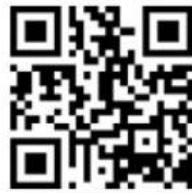
广西法学网手机版