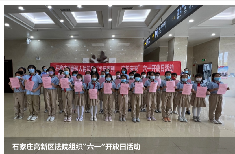
石家庄高新区法院组织“六一”开放日活动