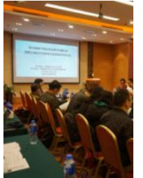
“多元视域下的近世法 届近代法律与社会转