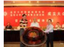
北京大学新媒体研究院、国家竞争力研究院成立