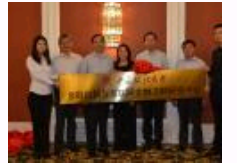
中国政法大学成立国内首个互联网金融法制研究中心