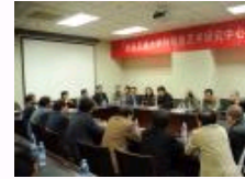
西安交通大学钟明善艺术研究中心成立揭牌