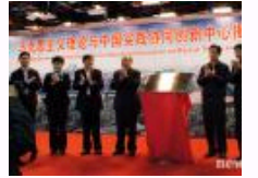
马克思主义理论与中国实践协同创新中心揭牌