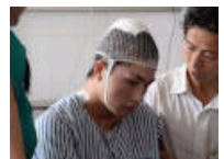
高校欲招夺刀少年