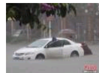
钦州遭大暴雨袭击