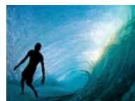
美摄影师冒险拍世