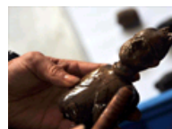
揭秘陶俑修复过程