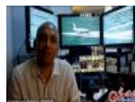
马航机长自拍曝光