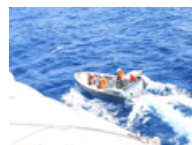
中国海军绵阳舰在