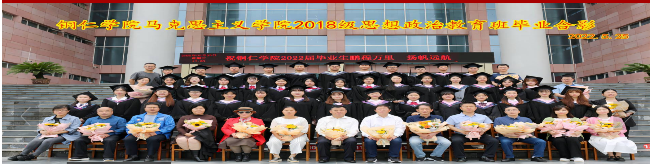
铜仁学院马克思主义学院2018级思想政治教育班毕业合影