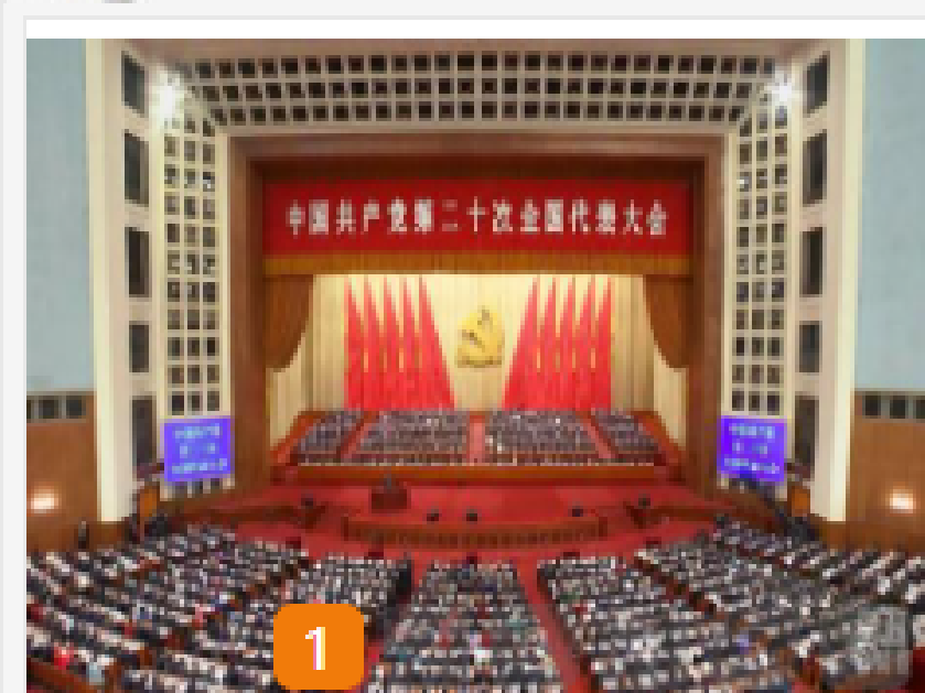
马克思主义学院思政课教师...