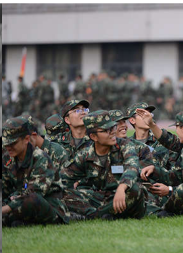
【组图】军训：汗水与欢笑中的青春记忆