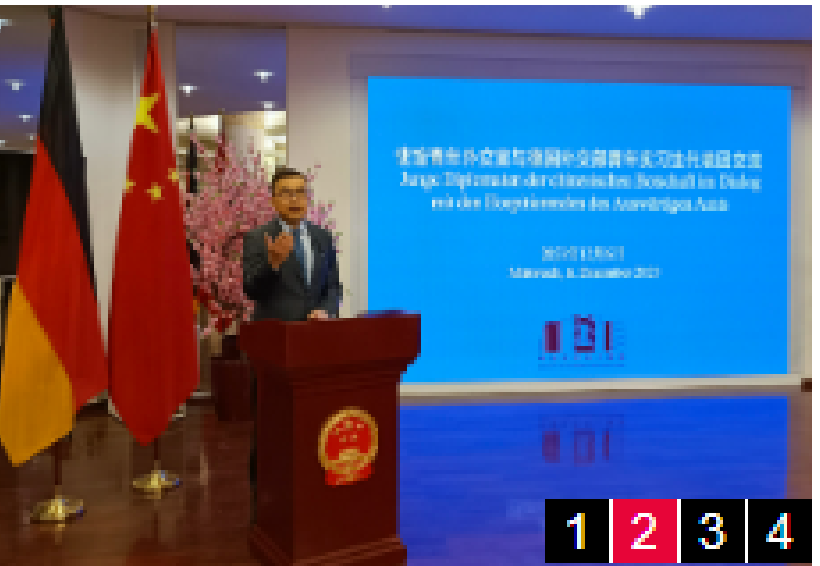
德国外交部青年实习生来驻德国使馆交流

12月8日，柏林动物园举办“梦想”、“梦圆”大熊猫纪念牌揭幕仪式。吴恳大使、柏林市长韦格纳、动物园园长克尼里姆和监事会主席布鲁克曼共同为纪念牌揭幕。