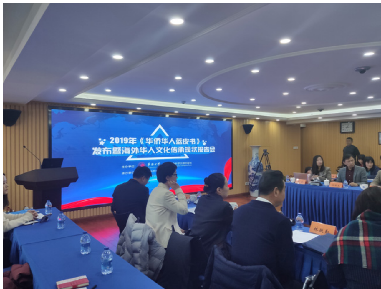
报告会现场