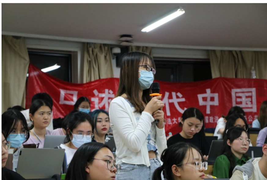
（同学们就感兴趣的问题积极提问）

2022年是中国与中亚国家建交三十周年，中国与中亚五国举行了元首视频会议。于部长借此回顾我国与中亚五国互帮互助、互利共赢的历程，为大家讲述风雨同舟30年的启示与展望。于部长高度肯定了共建丝绸之路经济带对中国和中亚五国的共同意义，并对未来的发展前景充满信心。